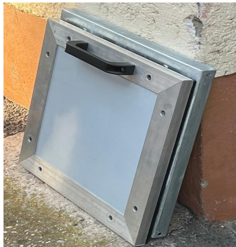
Fensterschotts und Dammbalken- Systeme