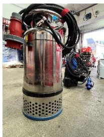
Pumpen und Sauger verschiedener Varianten